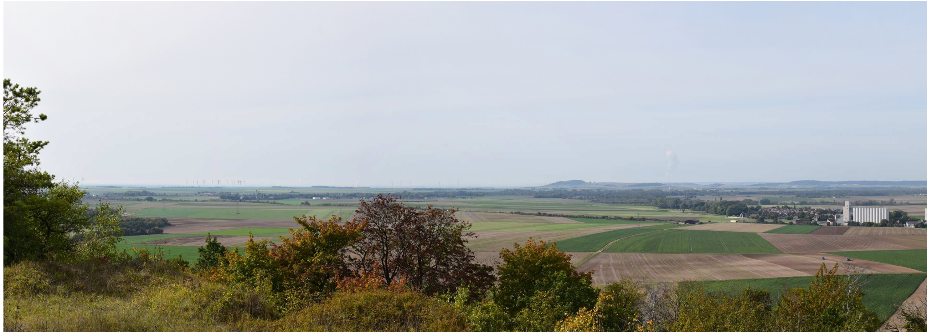
Le site actuel