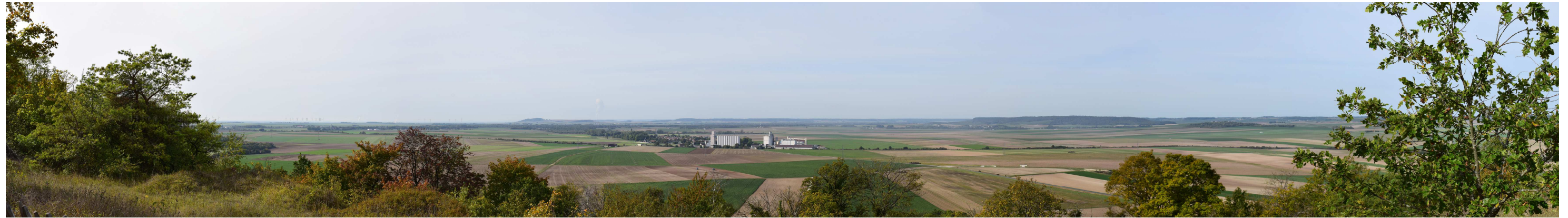
Le site actuel